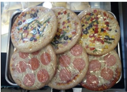
3 de cada variedad → intercaladas a lo largo